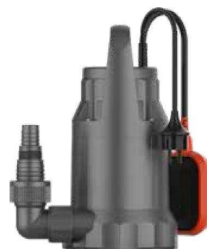
Per acqua pulita | Clean Water