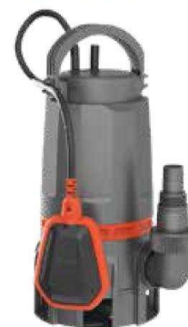
Combinata | Dirty & Clean Water